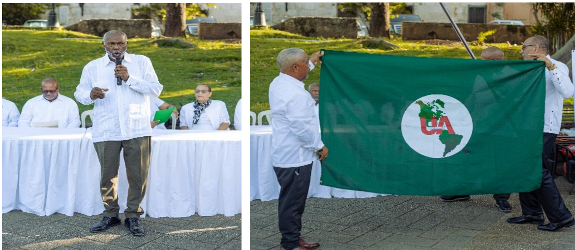
Durante la Proclama de la Organización Unión Americana, fue presentada al mundo por primera vez, la bandera de Unión Americana.

En este proceso inicial, cualquier persona que esté en cualquier posición de cualquier gobierno, podrá a la vez, ser parte de cualquier institución de Unión Americana. Personas de la sociedad civil podrán también, en cualquier tiempo, ser parte de Unión Americana. De manera que, instamos a los Estados a apoyar a cualquier ciudadano que tenga capacidad para ser parte del Congreso Americano, y que esté dispuesto a trabajar en la formación de Unión Americana a nivel continental.