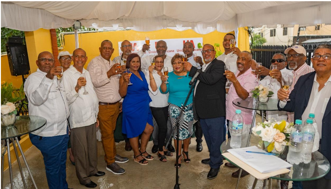
Miembros de Unión Americana UA, junto a un grupo de la sociedad civil y autoridades gubernamentales brindan por el futuro de la Organización Unión Americana durante la inauguración de sus oficinas en Santo Domingo.

PARRAFO I. Durante el proceso de formación, los Diputados Americanos trabajaran mayormente en la formación de Unión Americana.