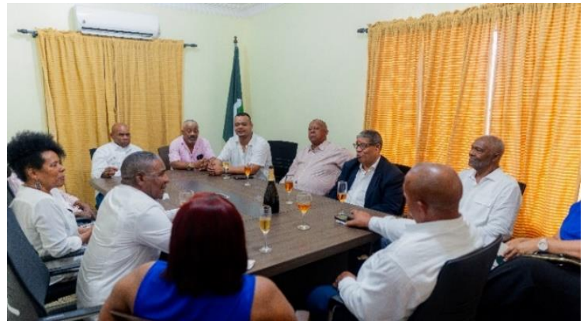
Discursos y brindis durante la inauguración de las oficinas de Unión Americana, donde varios líderes expresaron su interés en trabajar en la formación de Unión Americana UA.