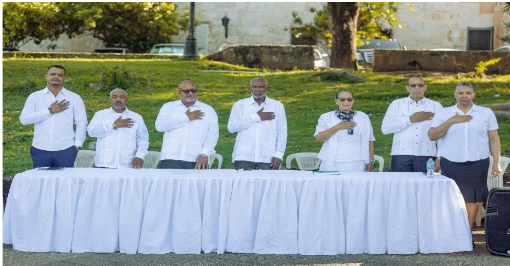
El Consejo Directivo de Unión Americana UA, en la Proclama de la Organización Unión Americana realizada en la Ciudad Colonial de Santo Domingo, el 12 de Octubre del año 2024.

La Proclama de Santo Domingo, realizada por la asociación Unión Americana UA junto a un grupo de la Sociedad Civil, en la emblemática e histórica Ciudad Colonial, el 12 de octubre del 2024, puso en marcha la formación de Unión Americana. Esta Organización, soñada por muchos líderes a lo largo de la historia, finalmente nació con el fin de implementar una unión económica estable entre los países que sean miembros, bienestar para los pueblos de América y una estricta protección al medio ambiente en un marco de independencia, libertad, respeto y soberanía de los Estados.